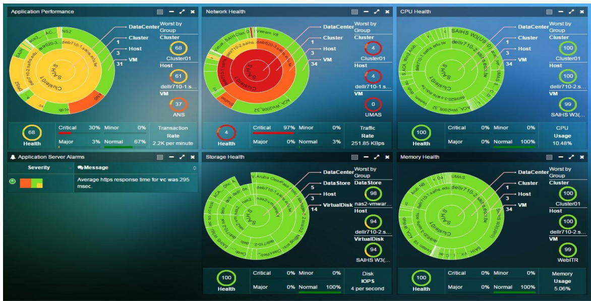
圖_ 2 校內各伺服器狀況分析