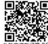
外縣市避難收容處所

註：避難收容處所及防災公園資訊可至「臺北市防災資訊網」/ 避難收容資訊查詢 ( https://www.eoc.gov.taipei )，或可掃描右上方QR碼查詢。