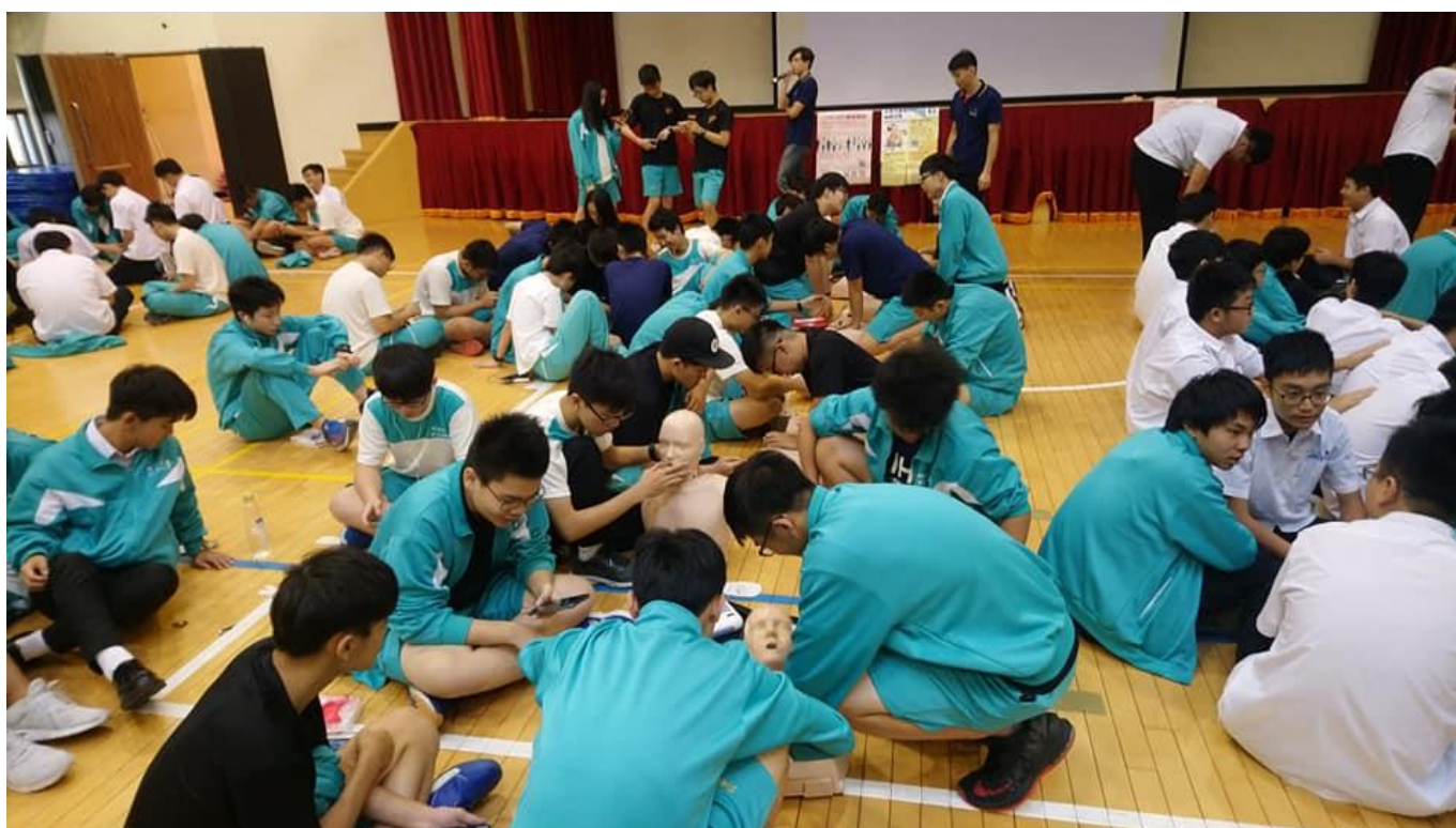
說明 12:108 學年度急救訓練課程