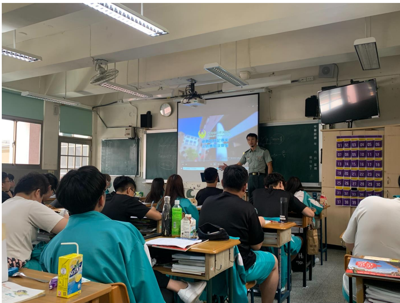
說明 7:108 學年度防災融入教學-地震避難