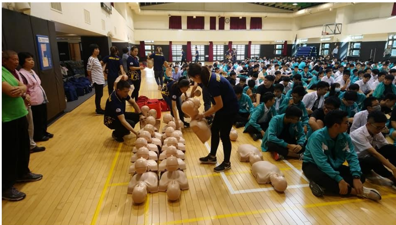
說明 10:108 學年度急救訓練課程