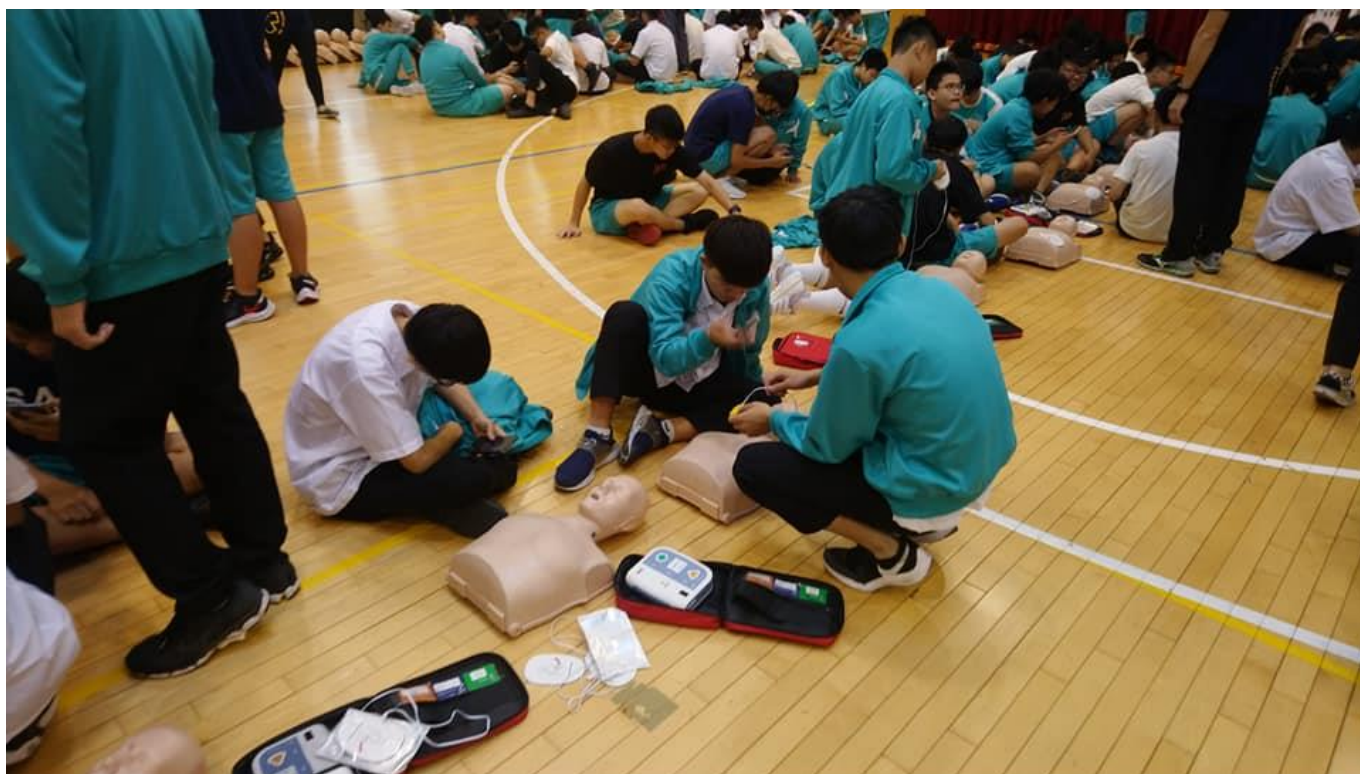
說明 11:108 學年度急救訓練課程