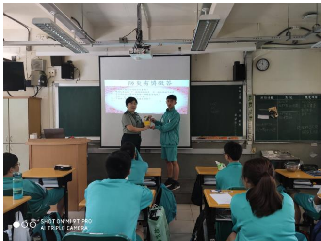
說明 5:108 學年度-防災融入課程-有獎徵答