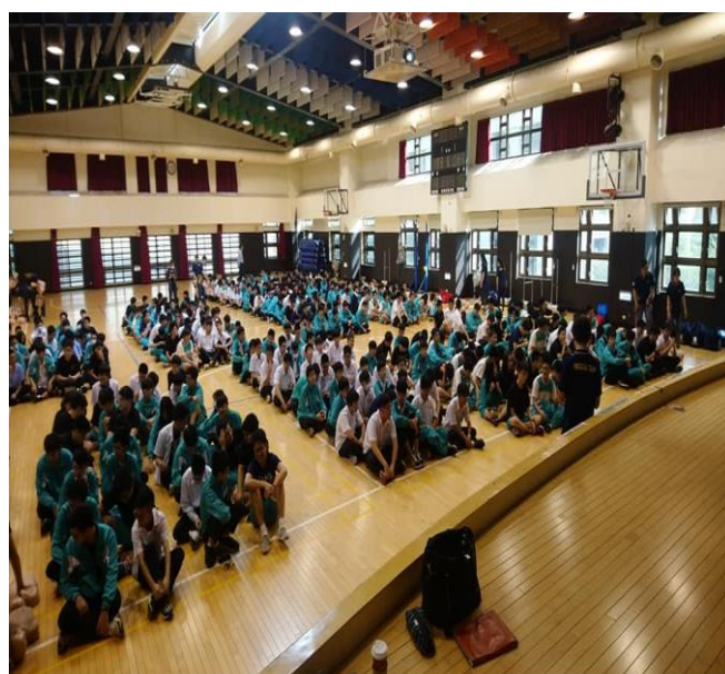
說明 9:108 學年度急救訓練課程