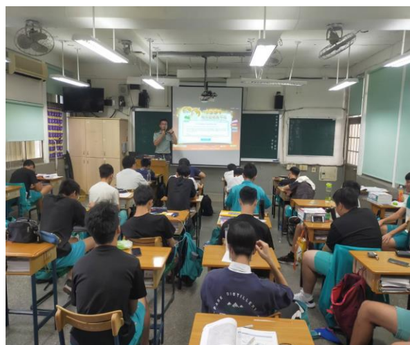
說明 2:108 學年度 1991 報平安平臺 教學