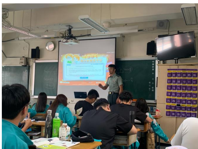
說明 3:108 學年度 1991 報平安平臺 教學