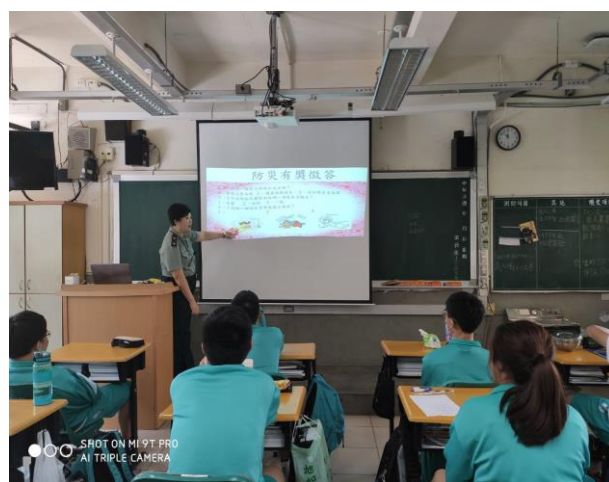
說明 4:108 學年度-防災融入課程 有獎徵答