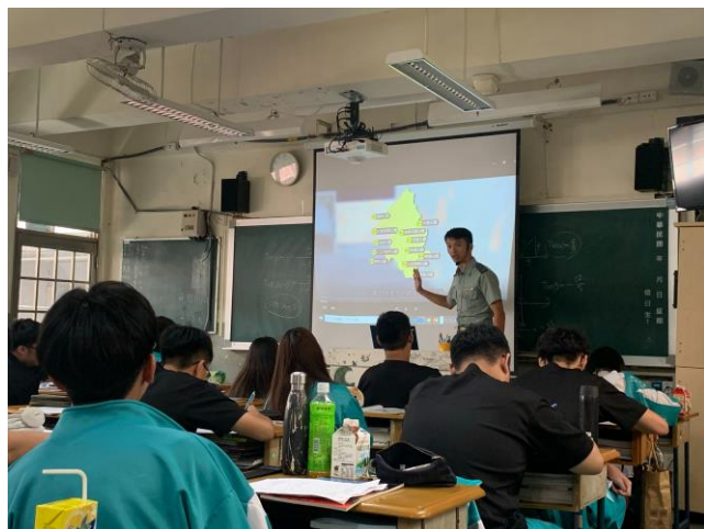
說明 6:108 學年度-防災融入課程-地震避難