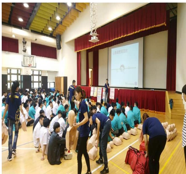
說明 8:108 學年度急救訓練課程