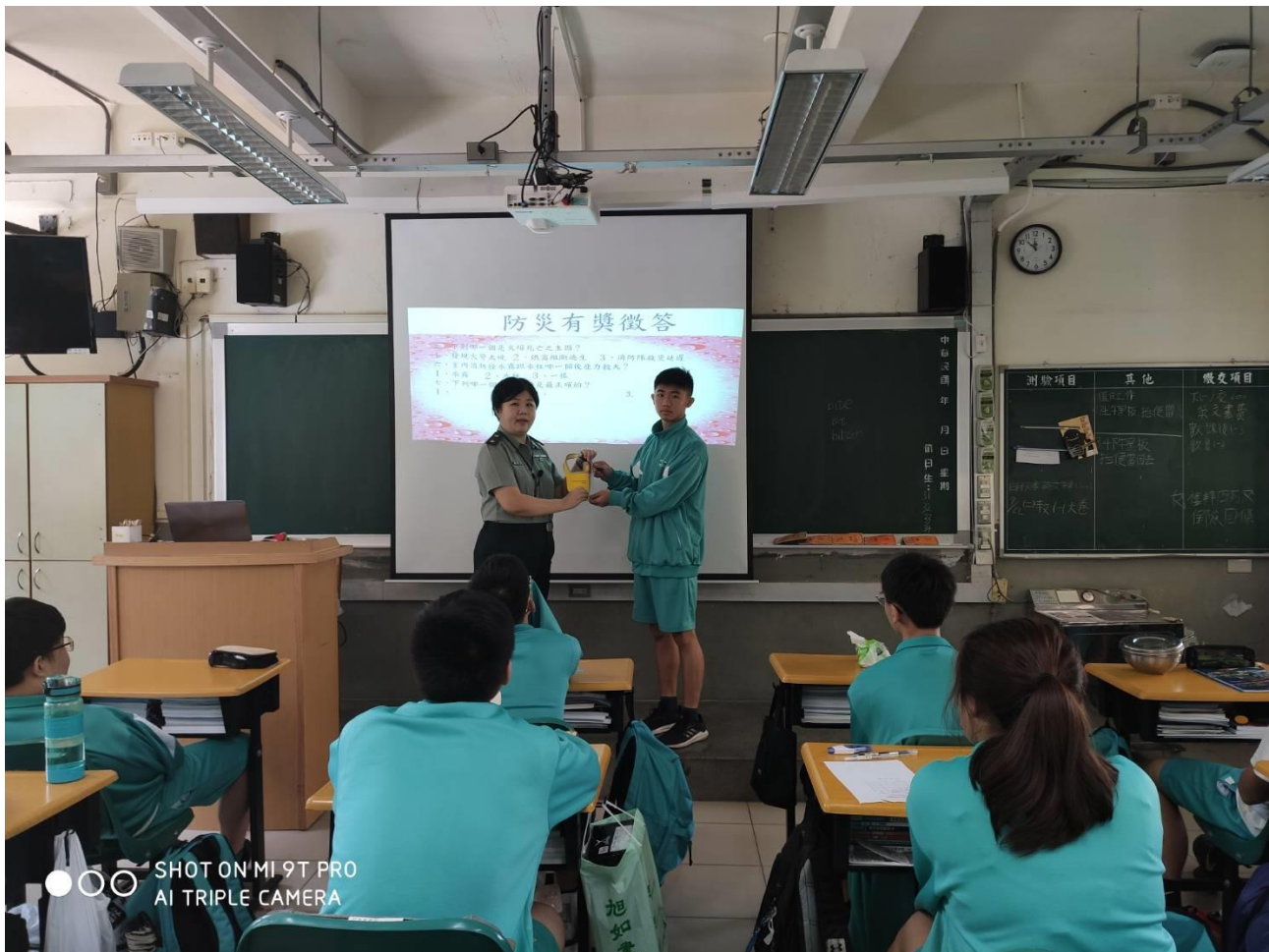
說明：108 學年度第二學期國防課防災教育課程有獎徵答