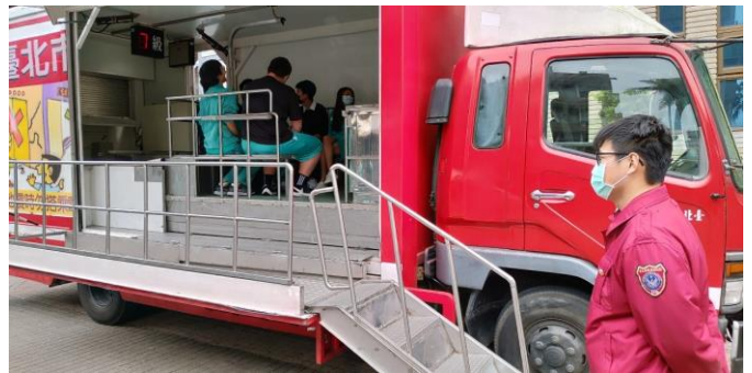
文字說明 滅火器操作示範、地震體驗車示範