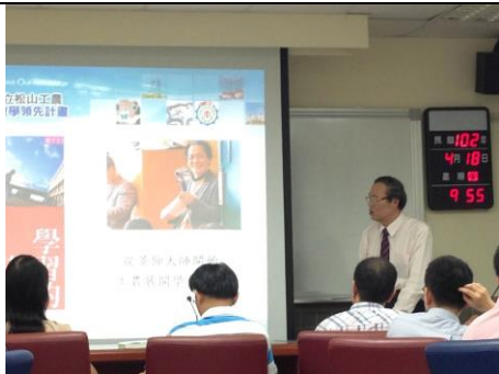
說明：校長於行政會報分享學習的革命