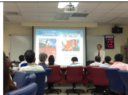
說明：同仁們仔細聽取簡報