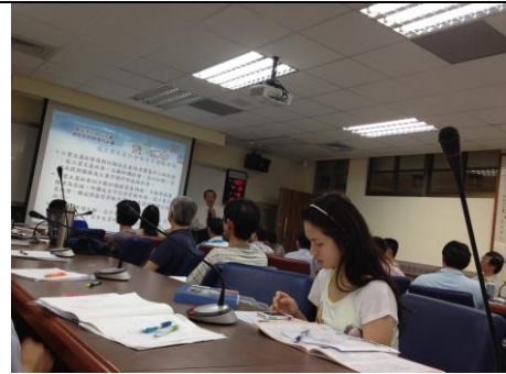
說明：於擴大行政會報分享