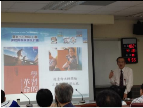
說明：校長於行政會報分享學習的革命