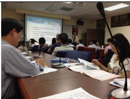
說明：於擴大行政會報分享