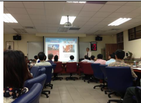
說明：校長於行政會報分享學習的革命