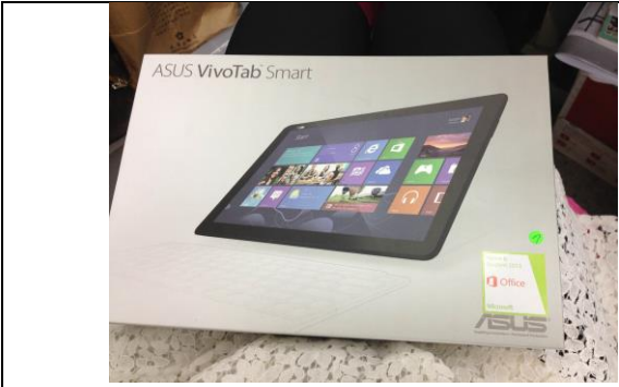
說明：發與行政人員平板