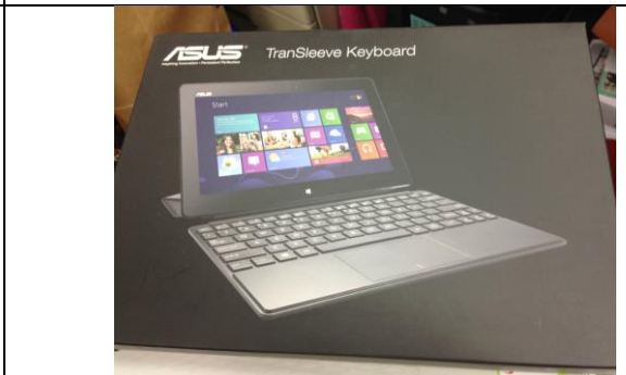
說明：提供藍芽無線鍵盤