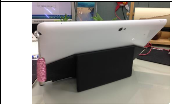
說明：後面有架子可以撐著