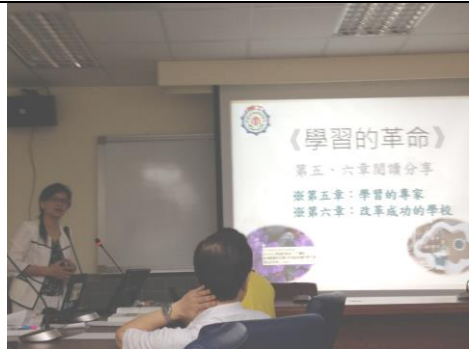
說明：於擴大行政會報分享