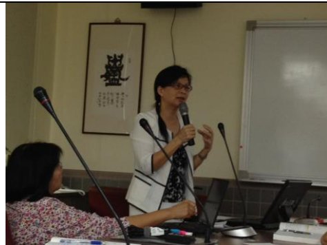
說明：校長於行政會報分享學習的革命