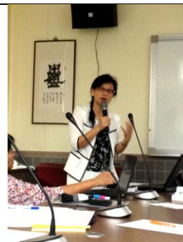
說明：影片與投影片並用