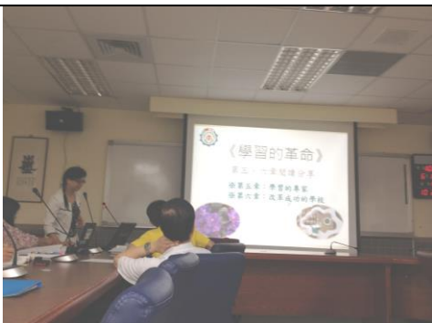
說明：於擴大行政會報分享