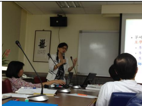
說明：同仁們仔細聽取簡報