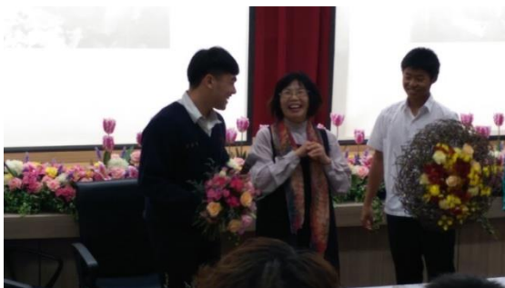
圖 7. 周老師高興的聽取同學心得