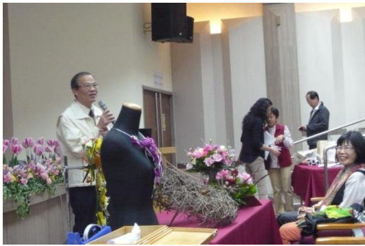
圖 1. 校長親臨致詞