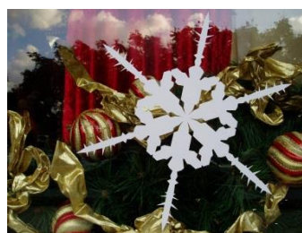
3：雪花(使用剪紙技巧)