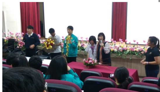
圖 8 周老師與同學分享作品特色與製