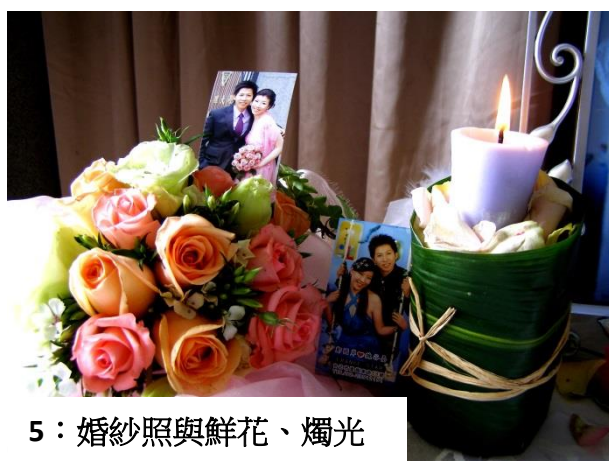
5：婚紗照與鮮花、燭光

以下以現代婚禮作為例子，在規劃婚禮慶典時必須要注意的相關內容，如何以創意的概念呈現美學的氛圍，例舉會場引導、花藝設計、禮品設計等作為說明。