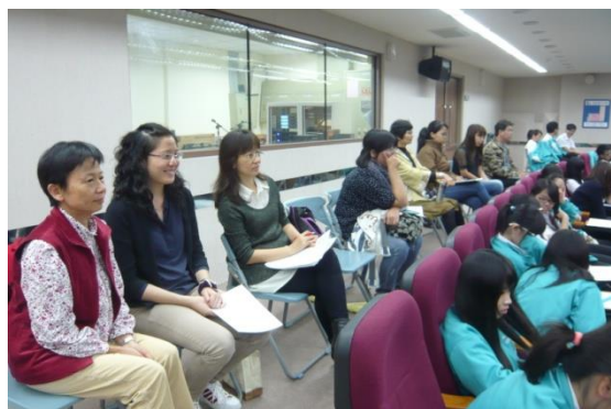
圖 9. 主任與教師們專心聽講