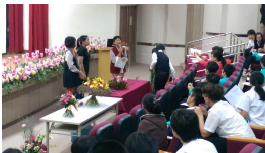
圖 10. 主任致感謝詞