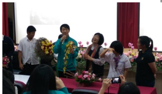
圖 6. 周老師開心的聽學生分享對於作 品的感動