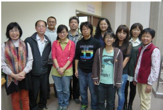
圖 12. 周老師與教師合影