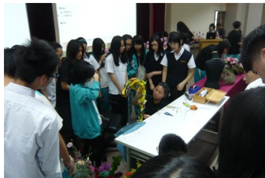
圖 4. 國手與學生講解材料與運用方式