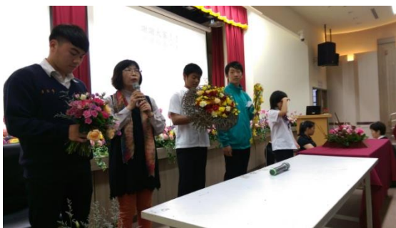
圖 5. 周老師與同學分享作品的技法與 評分要訣