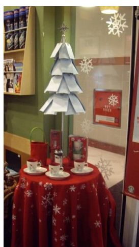
2：科技概念的聖誕樹