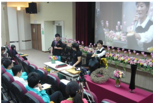
圖 3. 學生上台擔任模特兒示範花項鍊 穿戴方式