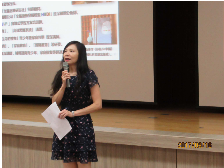
主任開場致歡迎詞