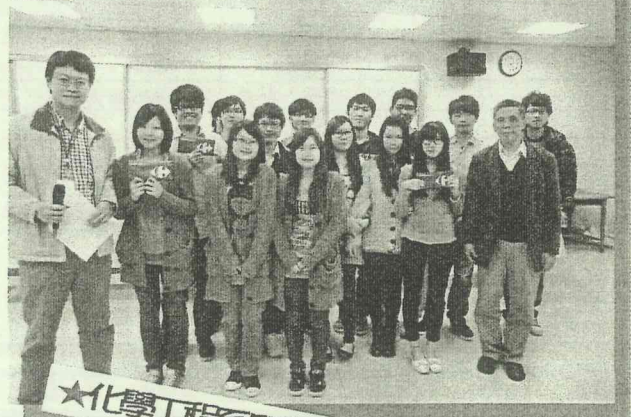
★化學工程系所歡迎你的加入