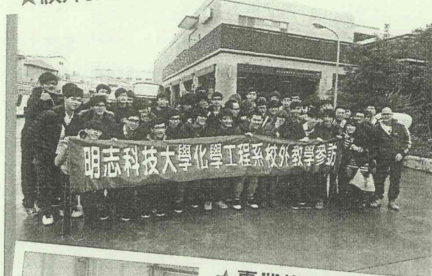
★校外教學參訪活動