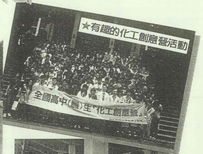
★有趣的化工創意營活動