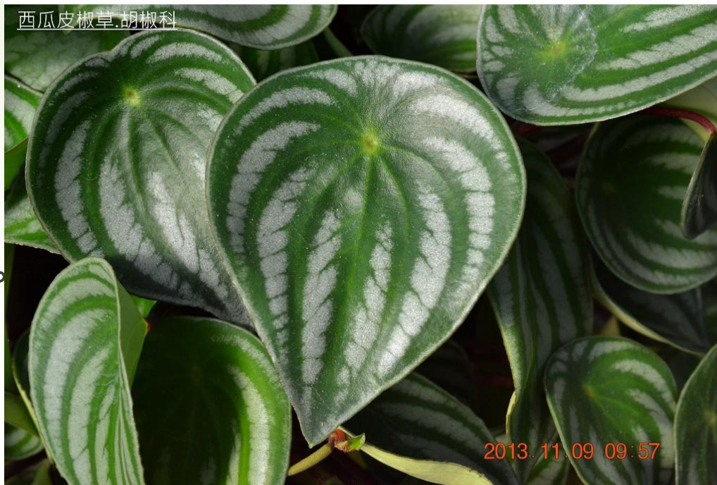
西瓜皮椒草 胡椒科

西瓜皮椒草，生長適溫為20-28°C，超過30°C和低於15°C則生長緩慢。耐寒力較差，冬季要求室內最低溫度不得低於10°C，否則易受凍害。常用分株和葉插繁殖。